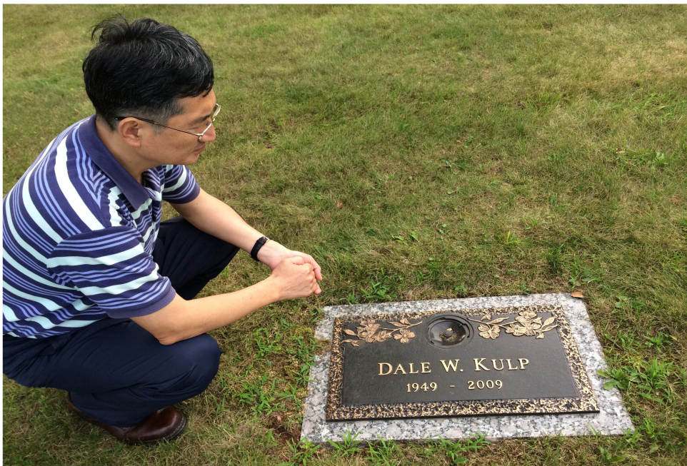
‘2017년 7월 연구년’에 ‘애슐리’의 안내로 대일의 묘소를 방문